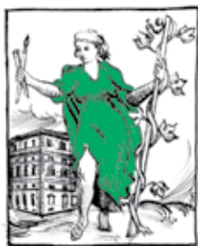
ARS TESTIS TEMPORUM

Sei appassionato d'arte e vuoi renderla una realtà viva?